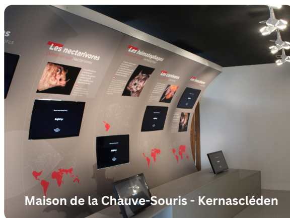
Maison de la Chauve-Souris - Kernascléden

Le Pays du roi Morvan est riche d'un dénivelé parfois important : pensez à vos mollets et économisez votre batterie pour pouvoir rentrer sans effort !