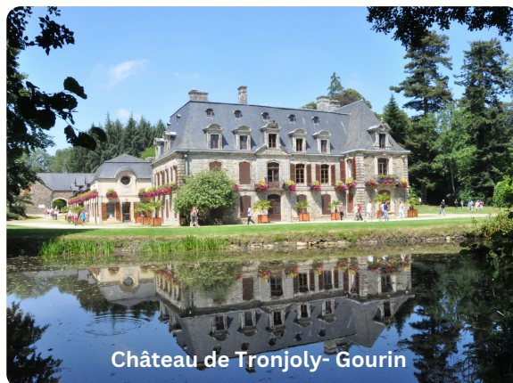
Château de Tronjoly- Gourin