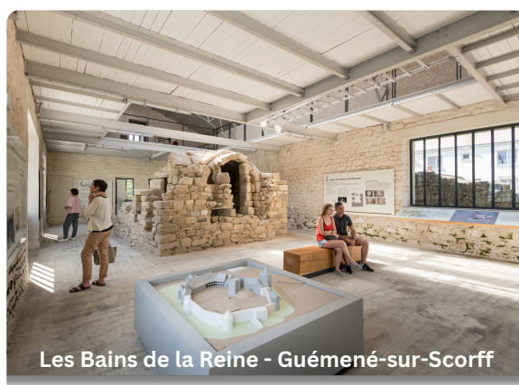
Les Bains de la Reine - Guémené-sur-Scorff