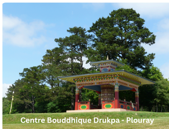
Centre Bouddhique Drukpa - Plouray