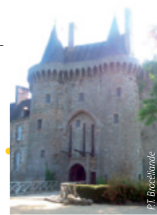
Le château de Montmuran.