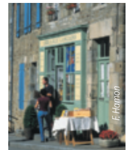
Bécherel, cité du livre.