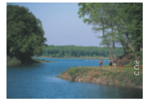
Etang du Boulet.