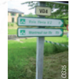
Itinéraire bien balisé.