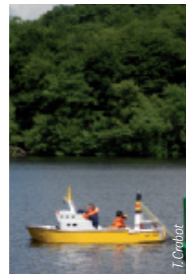
Port miniature de Villectartier à Bazouges-la-Pérouse.