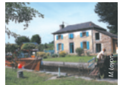
Le site des 11 écluses à Hédé.