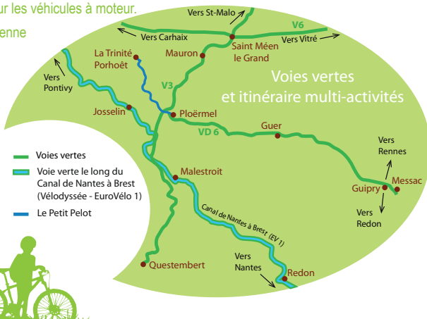
La voie verte à vélo