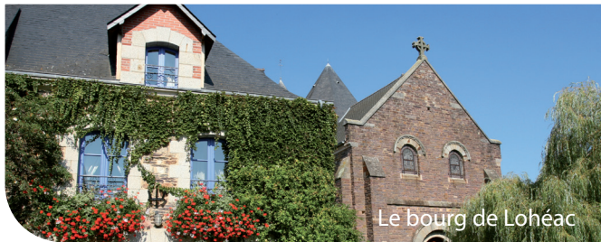
Le bourg de Lohéac