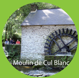
Moulin de Cul Blanc