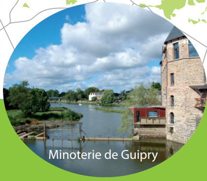
Minoterie de Guipry