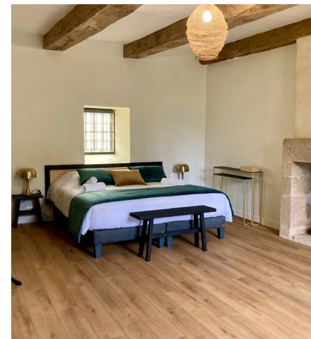
Hébergement au Manoir : 6 chambres doubles, 1 chambre triple ( jusqu'à 15 personnes ) En bonus : un dortoir de 9 personnes