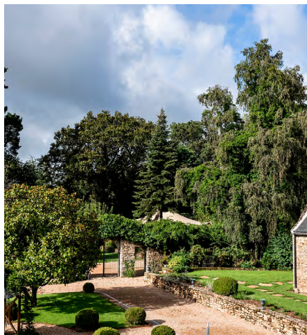
Parc arboré , jardin à la française et vaste tente nomade pour toutes vos activités extérieures, quelle que soit la météo