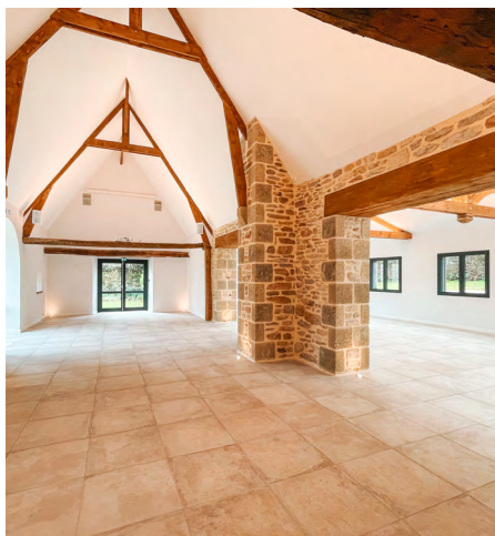
Double salle de réception/réunion Jusqu'à 140 personnes en cocktail

Le Manoir de Gouézac est un Domaine évènementiel chic, moderne et chaleureux , à l'image d'une maison de famille . À seulement 20 minutes de Vannes et à 1h30 de Rennes et Nantes , nous vous offrons un cadre élégant, paisible et convivial pour tous vos évènements.