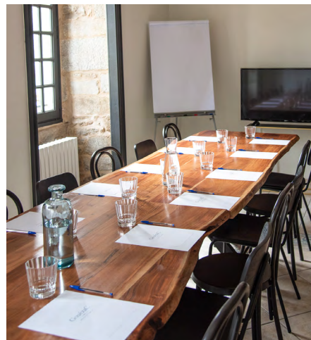
Réunions et team building au Manoir : jusqu'à 18 personnes