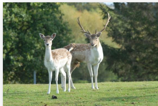
Les Cerfs de Kerfulus