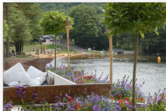
Anse de Sordan

Cléguérec – Silfiac : 14 km Silfiac – Saint-Aignan : 24 km St-Aignan – Cléguérec : 20 km