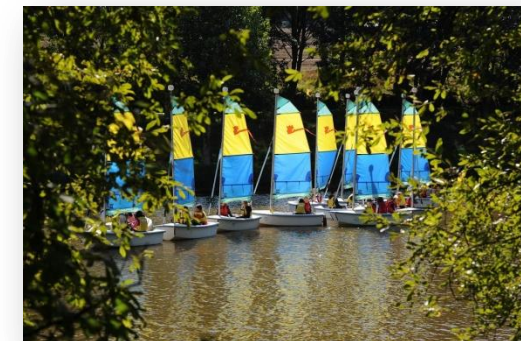
Etang du Pontoir