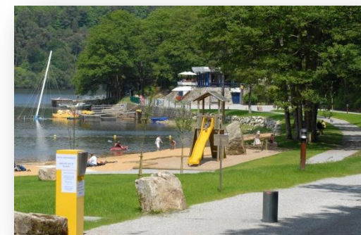
Anse de Sordan