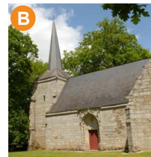
Chapelle ND de Joie