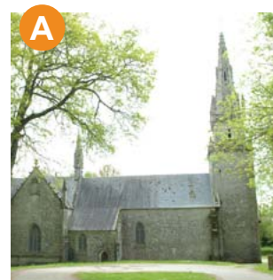
Chapelle ND de la Houssaye

Départ : Office de Tourisme de Pontivy Communauté 3 chapelles > 2 œuvres contemporaines